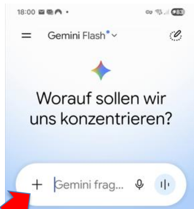
+ antippen und nächste Seite öffnet sich